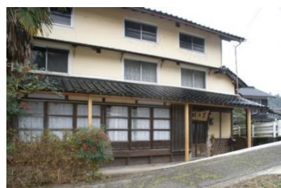
大屋町「みやがき結の里」